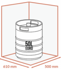
JUSQU'À 1 X 50 LITRES EURO