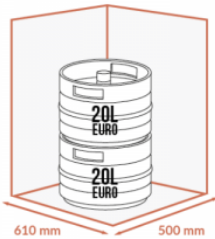
JUSQU'À 2 X 20 LITRES EURO SUPERPOSÉS