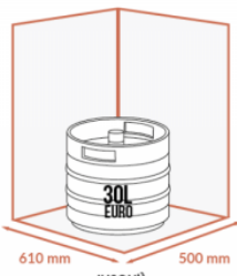
JUSQU'À 1 X 30 LITRES EURO SUPERPOSÉS