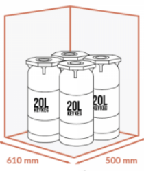
JUSQU'À 4 X 20 LITRES KEYKEG