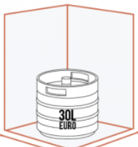
425 mm 510 mm JUSQU'À 1 X 30 LITRES EURO