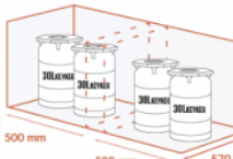
500 mm 500 mm 570 mm JUSQU'À 2 X 2 X 30 LITRES KEYKEG