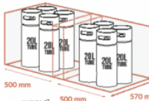
500 mm 500 mm 570 mm JUSQU'À 2 X 4 X 20 LITRES TUBE