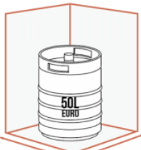
610 mm 500 mm JUSQU'À 1 X 50 LITRES EURO