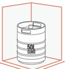
JUSQU'À 1 X 50 LITRES EURO