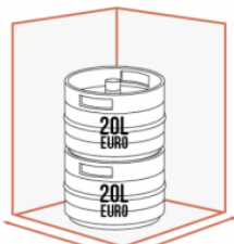
JUSQU'À 2 X 20 LITRES EURO SUPERPOSÉS