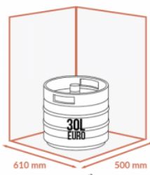
JUSQU'À 1 X 30 LITRES EURO SUPERPOSÉS