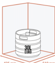
425 mm 510 mm JUSQU'À 1 X 30 LITRES EURO