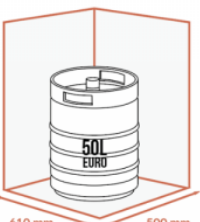
610 mm 500 mm JUSQU'À 1 X 50 LITRES EURO