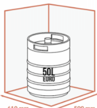
610 mm 500 mm JUSQU'À 1 X 50 LITRES EURO