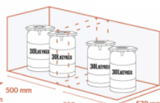
JUSQU'À 2 X 2 X 30 LITRES KEYKEG