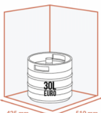
JUSQU'À 1 X 30 LITRES EURO