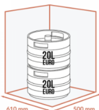
JUSQU'À 2 X 20 LITRES EURO SUPERPOSÉS