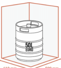
JUSQU'À 1 X 50 LITRES EURO