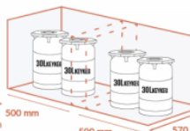
500 mm 500 mm 570 mm JUSQU'À 2 X 2 X 30 LITRES KEYKEG