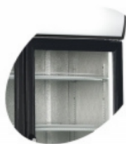
Lumière interne verticale