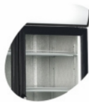
Lumière interne verticale